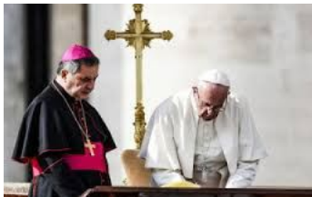
(Papa Francesco, Misericordia e misera , 14)

In un momento particolare come il nostro, che tra tante crisi vede anche quella della famiglia, è importante che giunga una parola di forza consolatrice alle nostre famiglie. Il dono del matrimonio è una grande vocazione a cui, con la grazia di Cristo, corrispondere nell'amore generoso, fedele e paziente. La bellezza della famiglia permane immutata, nonostante tante oscurità e proposte alternative: «La gioia dell'amore che si vive nelle famiglie è anche il giubilo della Chiesa». Il sentiero della vita che porta un uomo e una donna a incontrarsi, amarsi, e davanti a Dio a prometterci fedeltà per sempre,